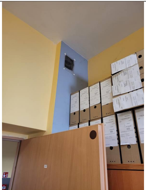
Stan istniejący (pomieszczenie nr 19):