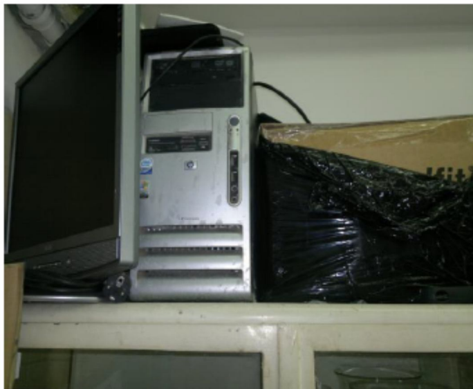
Komputer HP dx7300