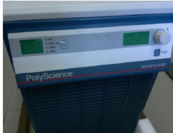
Spektrometr ICP – OES OPTIMA 2100 DV z chłodnicą PolyScience