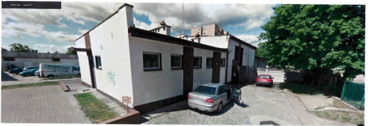
Działka o numerze ewidencyjnym 249 obręb nr 0002 „Matejki” w Głogowie